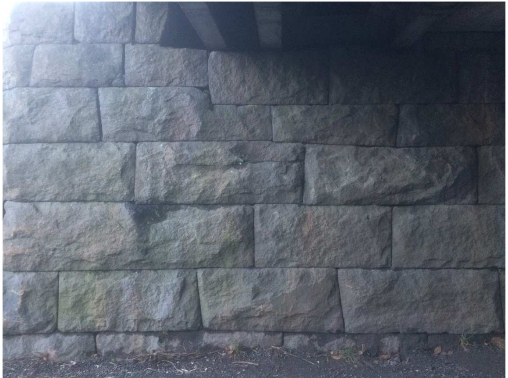
Mur under gangbane og trau – sydvest