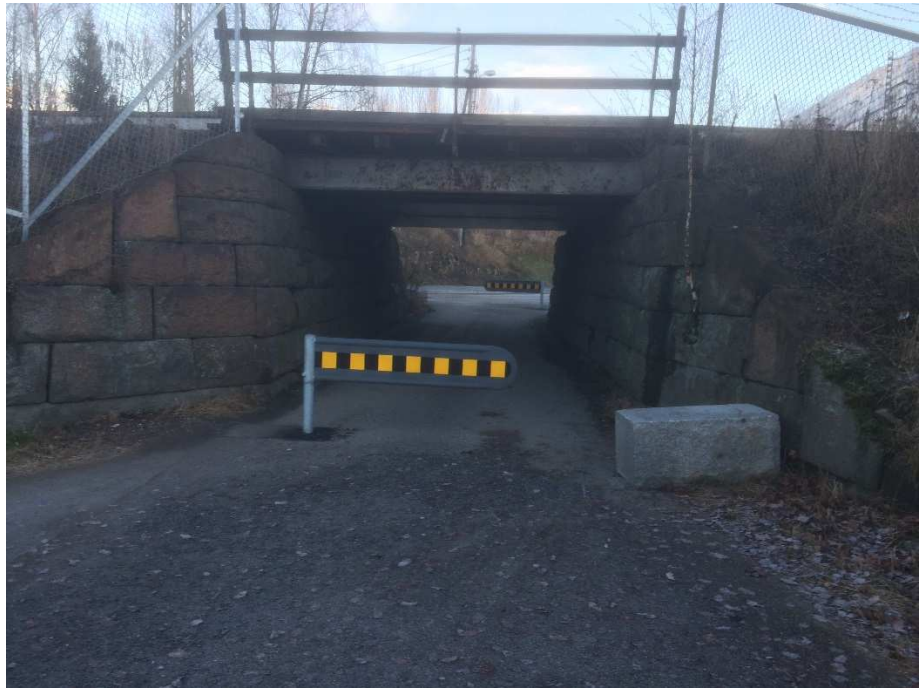
Gangbane i tre på stålbejelker. Undergang sett fra syd.

Rekkverket på tredekket er et helt enkelt rekkverk med bord på trestolper. Rekkverket i andre enden av undergangen er et enkelt stålørersrekkverk festet på trauelementene.