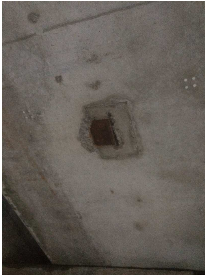
Innstøpt stålplate bruelement

Overbygningen består av to stk. betongtrau, ett for hvert spor. Betongtrauene er kun observert fra undersiden. Det er ingen synlige skader på betongen. Under traueene er det innstøpt ståldeler som sannsynligvis har vært benyttet i forbindelse med produksjon og innheising, se bilde. Ståldelene har etterhvert begynt å ruste, men har ikke gjort noen skade på betongelementene.