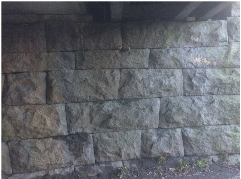
Mur under trauelement og gangbane – sydøst