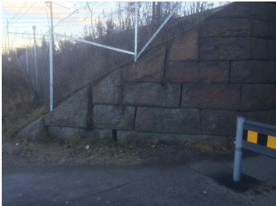
Vingemur – sydvest

På begge ender av undergangen er det vingemurer i forlengelse av landkarene. Formålet med disse er å holde på massene i jernbanefyllingen til fyllingen er nede på omkringliggende terreng. Murene har en naturlig avtrapping i toppen som følger skråningsutslaget på jernbanefyllingen. Vingene på nordsiden har ingen synlige skader. Her er det også synlig berg i dagen slik at det er sannsynlig at disse er fundamentert direkte på berg. Vingemuren i den sydøstre enden har heller ingen skader. Her ligger også berget forholdsvis grunt og muren er sannsynligvis fundamentert direkte på berg. Muren i sydvestre ende har noen litt større vertikale åpninger mellom steinene ytterst i vingen, se bilde. Dette kan tyde på at det har vært en liten bevegelse som kan være forårsaket av mindre setninger i ytre enden av vingen. Her er dybden til berg ca. 2,2 m og ytre del av vingen er sannsynligvis ikke ført ned til dette nivået. Denne forskyvningen er ikke dramatisk og har ingen konsekvens for fyllingens stabilitet.