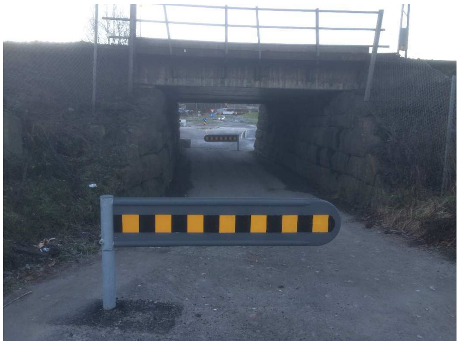
Undergang sett fra nord

Rekkverket på tredekket er et helt enkelt rekkverk med bord på trestolper. Rekkverket i andre enden av undergangen er et enkelt stålørersrekkverk festet på trauelementene.