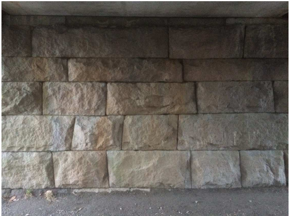
Mur under trau – nordvest