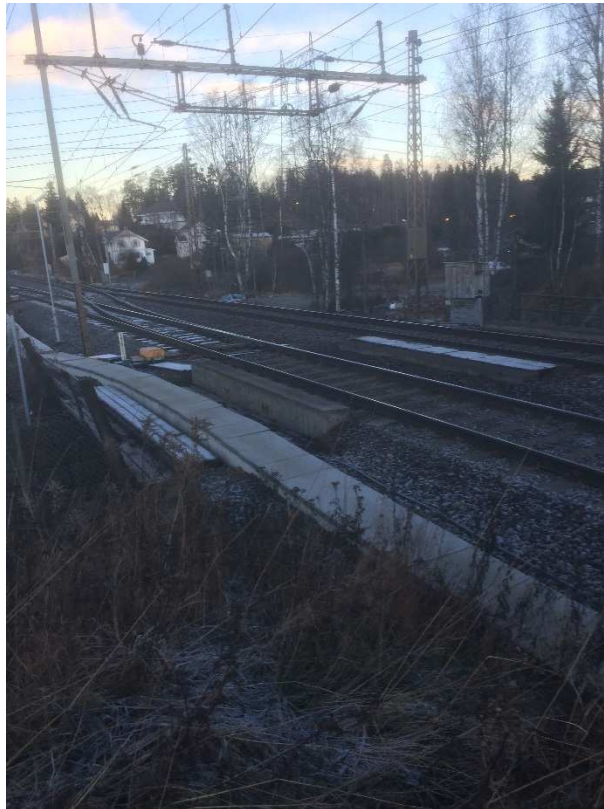
Bilde 1 Overside undergang