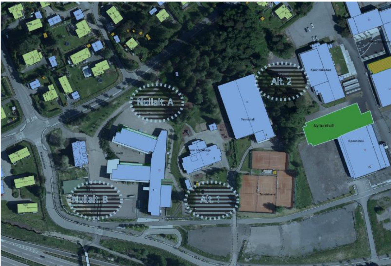
Figur 1: Oversikt over plassering av de ulike alternativene (nullalt. A, nullalt. B, alt. 1 og alt. 2)

Figurene under viser plassering av de ulike alternativene, friområdet og støysoner: