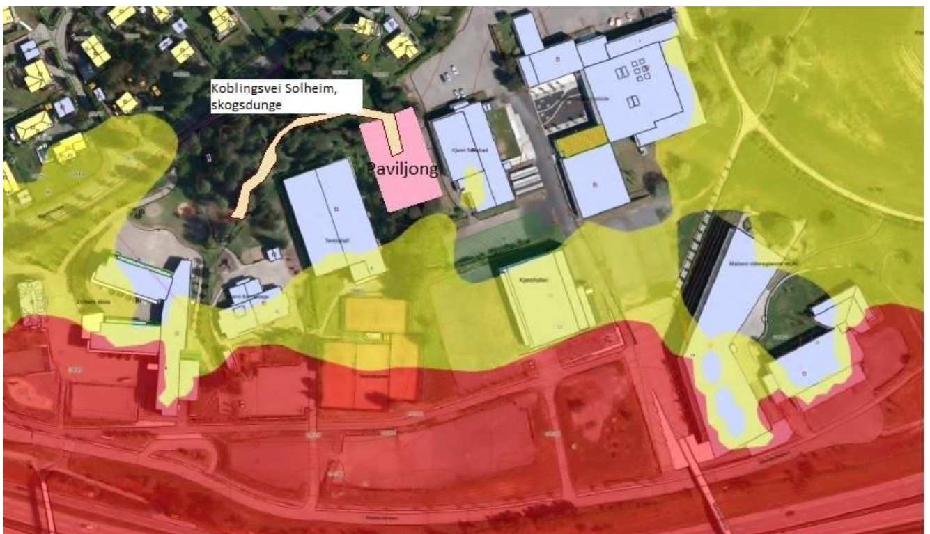
Figur 3: Støysonekart.