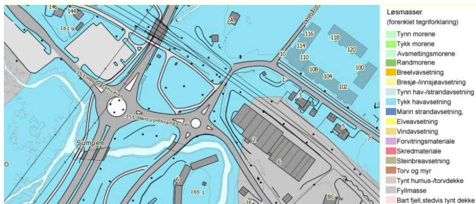
Figur 1) Kvartærgeologisk kart fra NGU

Kvartærgeologisk kart angir løsmasser bestående av fyllmasser mot øst, omringet av tykk havavsetning.