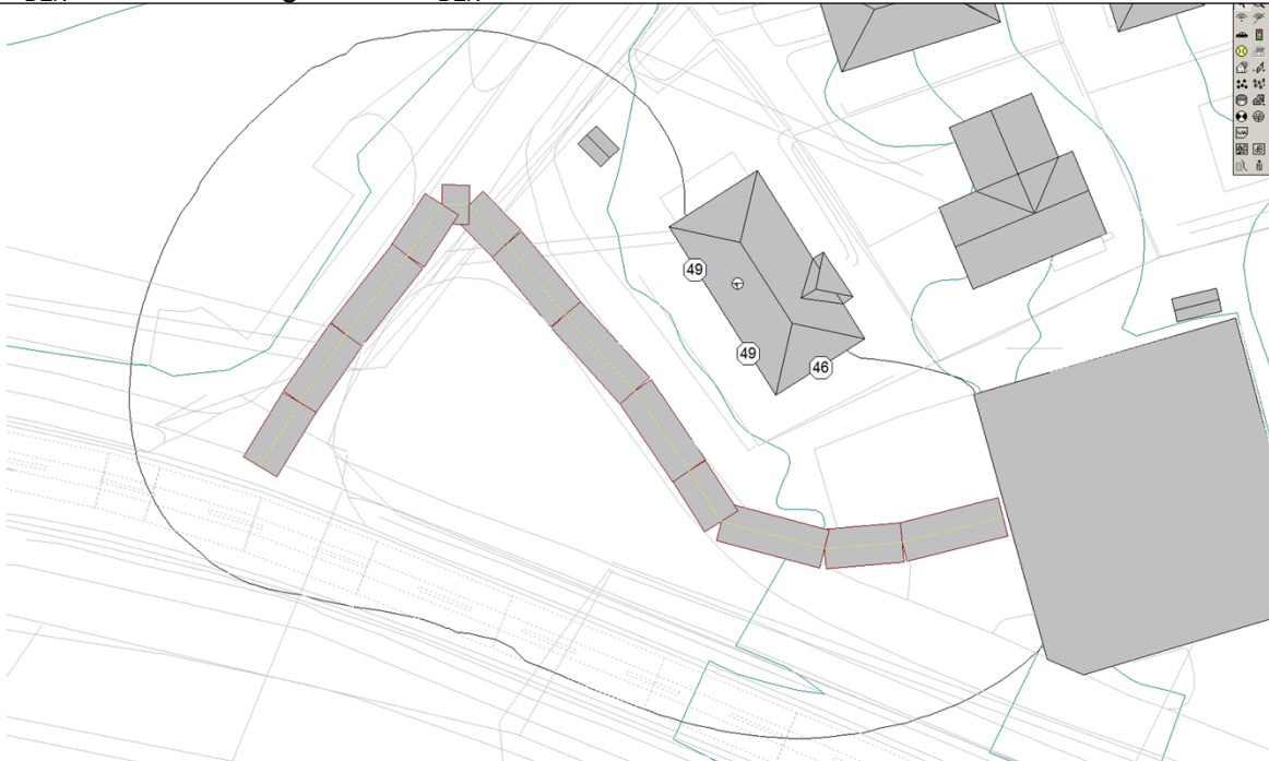
Bilde 2: Utsnitt fra beregning, L_{DEN} fra adkomstvei til avfallsanlegg. For å beregne mest ugunstige tilfelle er all trafikk lagt inn i kveldsperioden. Gul og rød sone synes ikke på bildet, fordi støynivået er lavere enn grenseverdi.