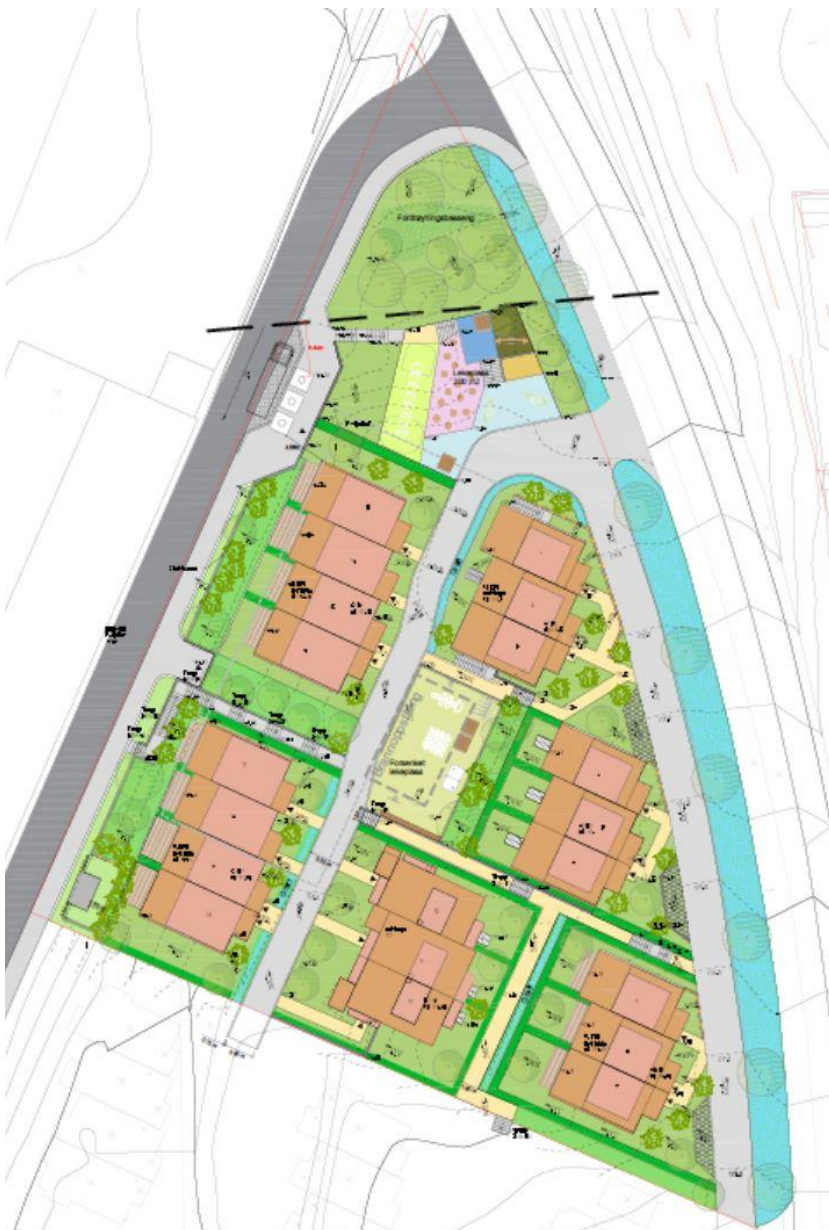
Illustrasjonsplan Gamleveien 3B

Konsulent er Arkitektene Dahl & Myrhol AS, Wilses gate 4, 0178 Oslo