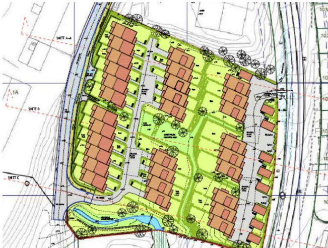
Kartutsnitt av Gamleveien 3C

Renovasjonsbilen kjører fra krysset Lysåsbakken/ Lysåsveien til vendehammer i Gamleveien 3C og snur der, henter avfall ved vendehammeren, og kjører tilbake til nytt hentepunkt i Gamleveien 3B. Løsningen medfører minimal konflikt med andre trafikanter eller gående.