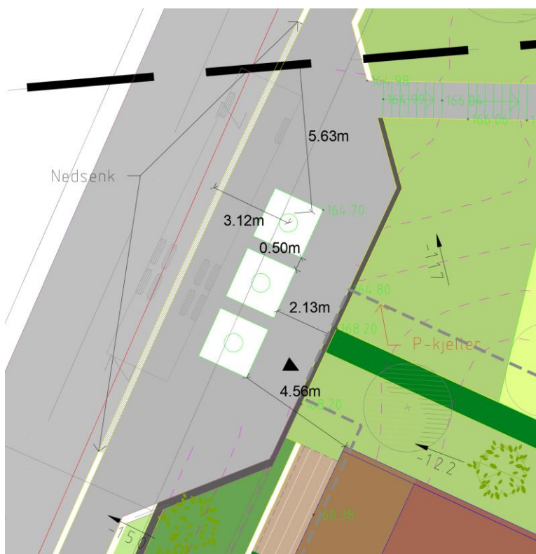
Detaljtegning med diverse målsetting av avstand til avfallsnedkast.