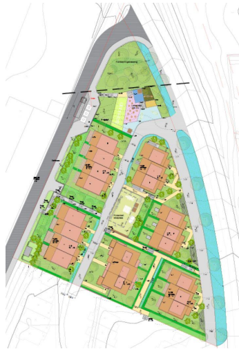
Kartutsnitt av Gamleveien 3B