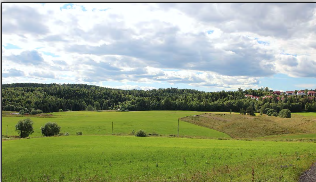
Foto 10: Beiteområder ved Hauger med bebyggelsen på Vallerud i bakgrunnen, Ana Nilsen