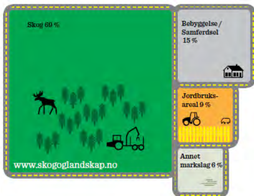
Fig 1: Markslagsfordeling i Lørenskog

I Lørenskog er det åpnet for jakt etter elg, rådyr og bever, i tillegg til annen småviltjakt. Jakt som friluftslivsaktivitet er for mange viktig. I kommunen er det av store rovdyr, både gaupe og ulv. Lørenskog kommune ligger innenfor ulvesone 4 og ulven har etablert et revir i Østmarka. Fiske er en annen form for fangst og friluftsliv som er viktig.