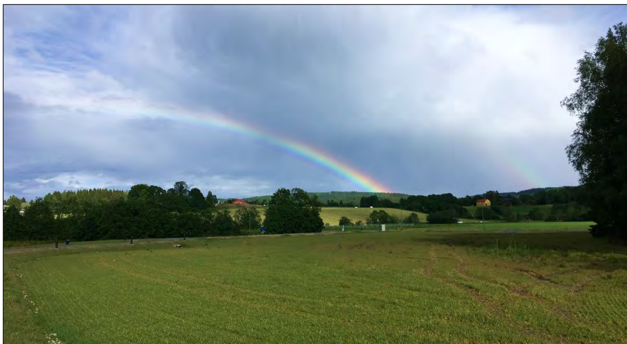
Foto 3: Elveparken ved Torshov med jordbruksarealer på Hammer i bakgrunn