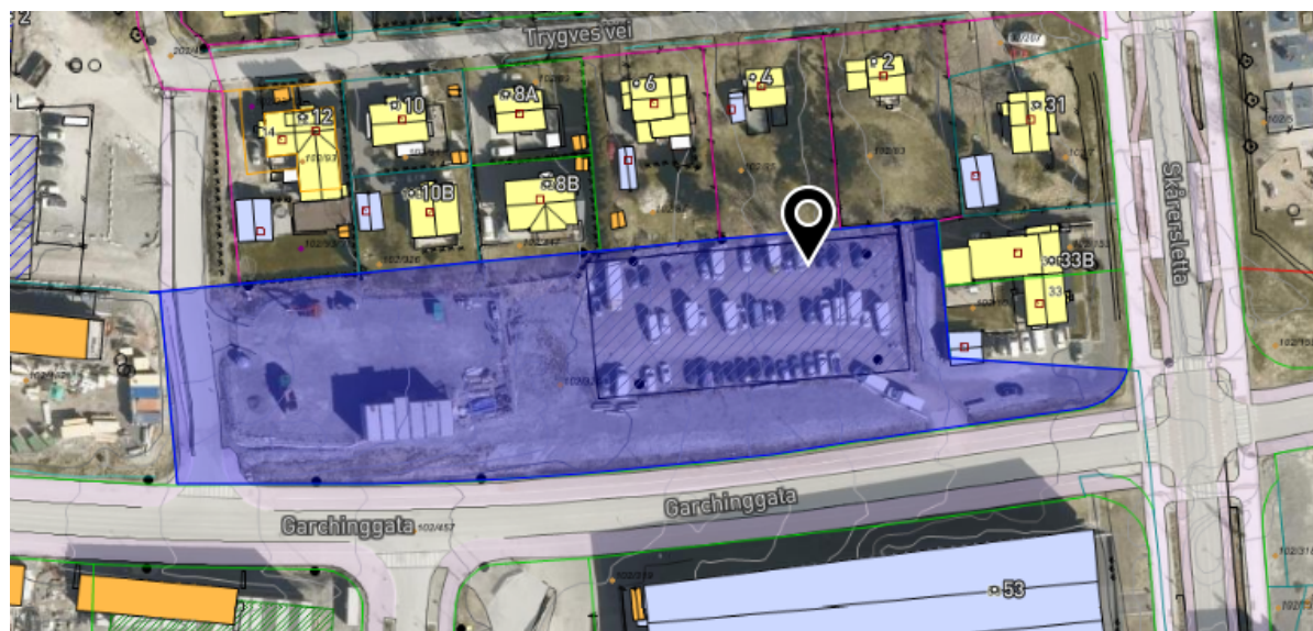
Figur 1: Kartutsnitt Garchinggata, gnr./bnr. 102/324

Kommunen eier en tomt på 7,5 daa. i Garchinggata (gnr./bnr. 102/324) der det foreligger et politisk vedtak om å regulere tomten til bolig og næring, og deretter selge den. Se kartutsnitt nedenfor.